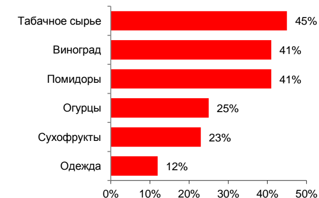
Илл. 2. Доля Турции в российском импорте, %